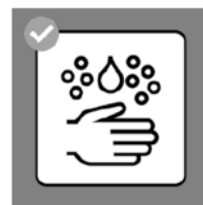
Gründlich Hände waschen