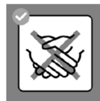
Hände schütteln vermeiden