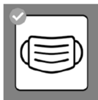
Maskenpflicht (siehe unten)

In Bezug auf die Durchführung der Gemeindeversammlung gelten im Übrigen die Hygiene- und Schutzvorschriften des Bundes.