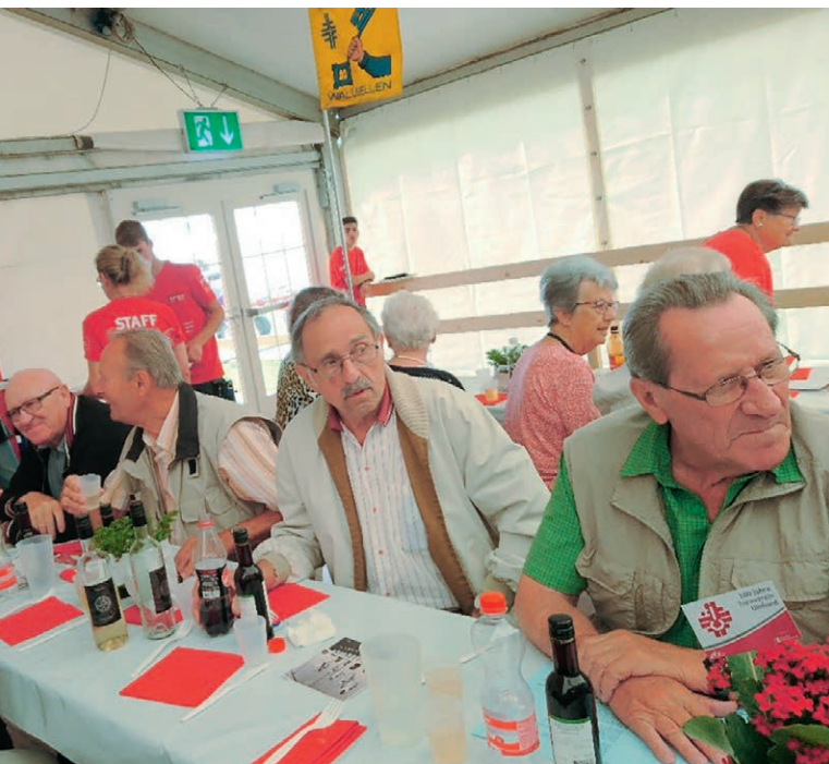
Die Veteranen des OTVG in Dinhard