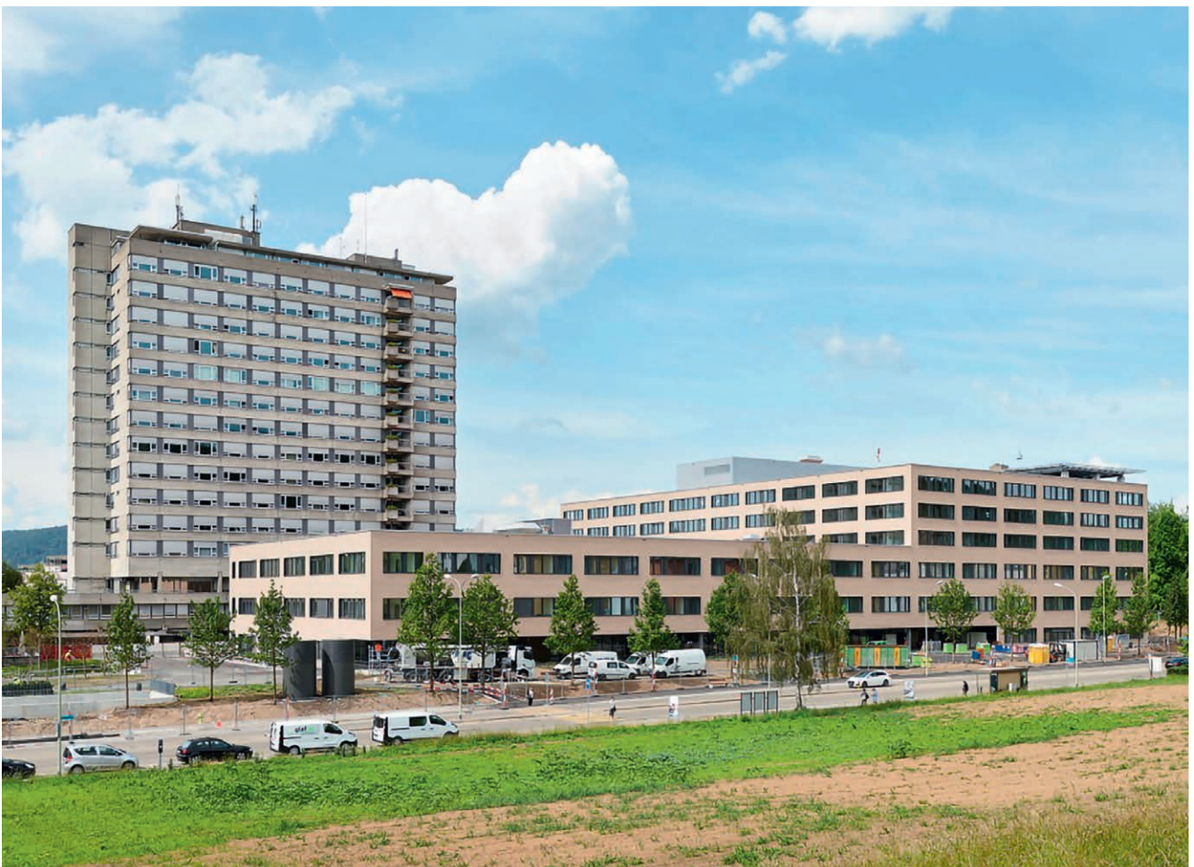
Neu- und Altbau Spital Limmattal

Der Neubau hat ein Volumen von 205'000 m 3 und eine Geschossfläche von 48'500 m 2 . Das Spital bietet Platz für rund 11'000 stationäre und 70'000 ambulante Patienten pro Jahr. Unter den 2'000 Räumen finden sich acht Operationssäle sowie acht Intensivpflege-, neun Überwachungs- und zwölf Tagesklinikplätze. Das Spital Limmattal finanziert sowohl den Neubau als auch den Betrieb und die laufenden Investitionen aus eigener Kraft. Das in den 70er-Jahren erstellte Spitalgebäude wird bis ins zweite Untergeschoss rückgebaut.