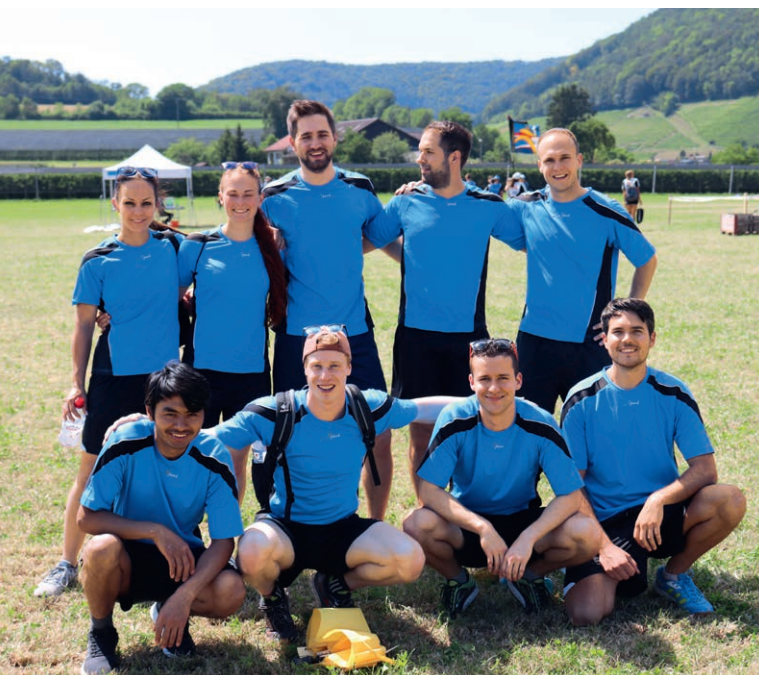
Die Gruppe der Aktiven nach dem Wettkampf