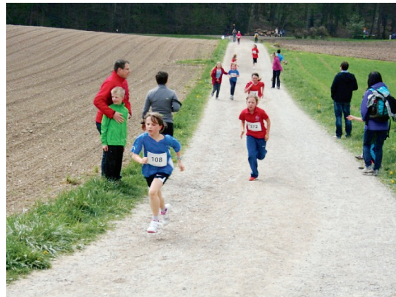
Zieleinlauf des Wiesentälilauf