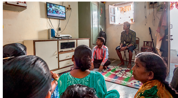
Diskussion der Vertrauensgruppe mit dem Berater

Überraschend berichtet eine Kundin (gewählt sei ein Beispiel aus Indien), wie sich ihre Lebensumstände verbessert hätten. Die 30-jährige alleinerziehende Mutter kann heute ihre drei Kinder selber ernähren. Selbst Waise, veränderte sich ihr Leben grundlegend durch die Chance, die ihr der erste Kredit bot.