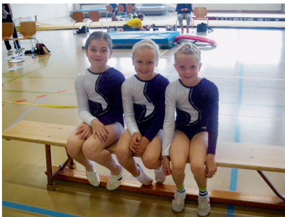
Kant. Frühlingwettkampf (Getu)